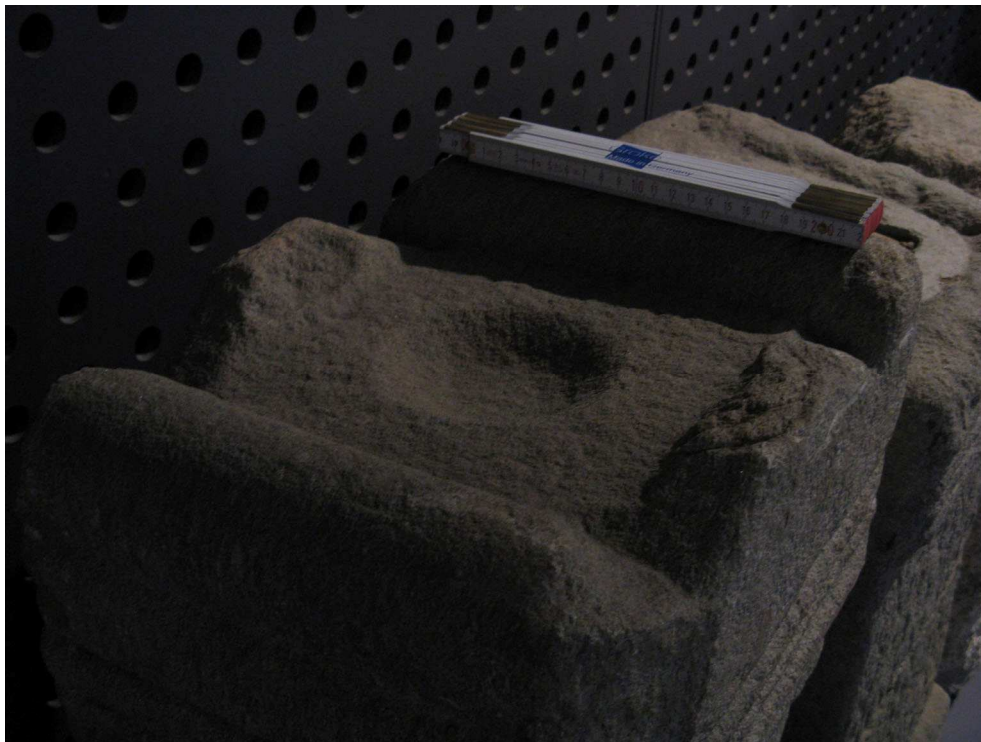
Ara a Larouco.